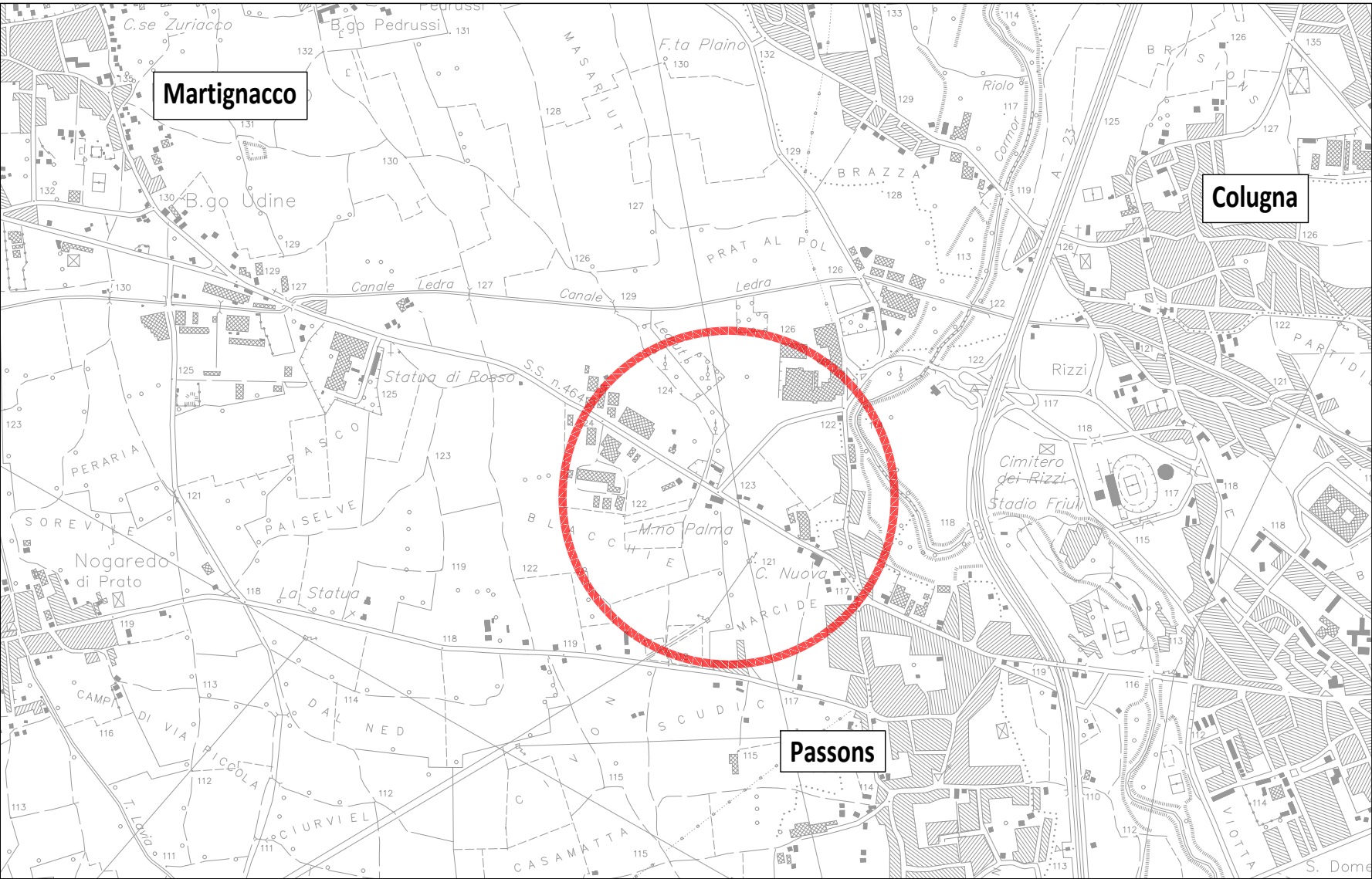
Inquadramento Scala 1:25.000